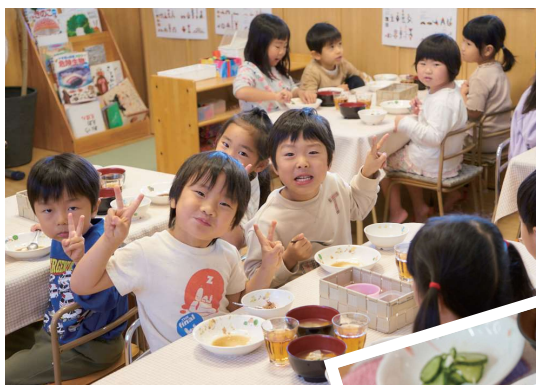
身体がつたえ ちていっしょに 味わう