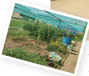
お米や野菜を子どもたちと いっしょに育てている菜園